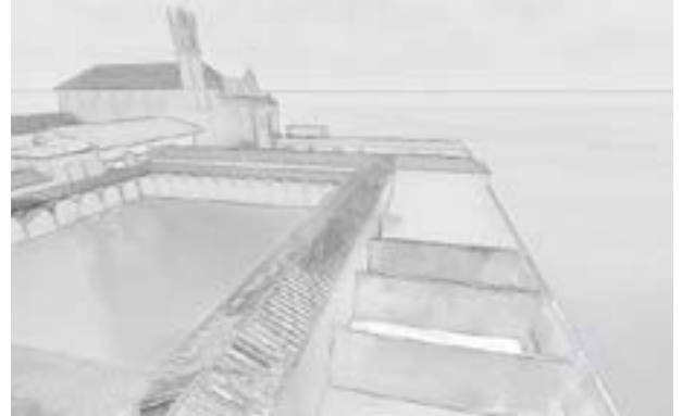
Imagen de la Cartuja en sus orígenes.

Las mejoras están encaminadas no sólo para que los visitantes disfruten de la belleza artística, sino para ensalzar el lugar sagrado que es el monasterio, donde a lo largo del año tienen lugar algunas celebraciones litúrgicas, y contemplar y tomar conciencia, a través de la belleza en el arte, de nuestro vínculo con Dios. Asimismo, son unas mejoras dirigidas a revalorizar el complejo y su historia, "al servicio de la misión de la Iglesia en todos los sentidos (evangelización y pastoral principalmente, y en ese mismo marco, conocimiento de la historia de la Iglesia y del significado cristiano de su patrimonio)", según consta en el Decreto de nuestro Arzobispo por el que se da un Estatuto eclesial y se crea un Consejo para la conservación de este lugar de la Iglesia de Granada.