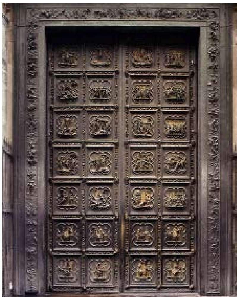
Puerta norte del Baptisterio de la Catedral de Florencia.