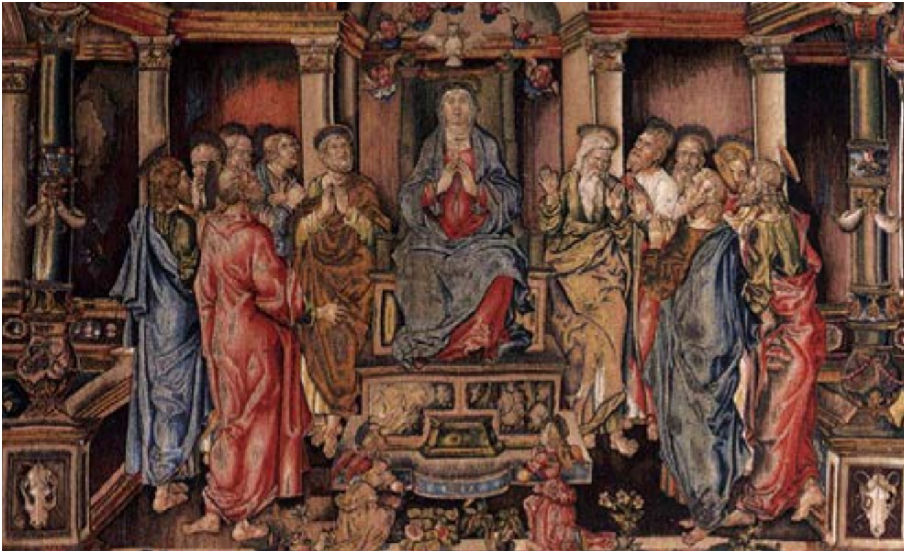
Pentecost. Lazzaro Bastiani.