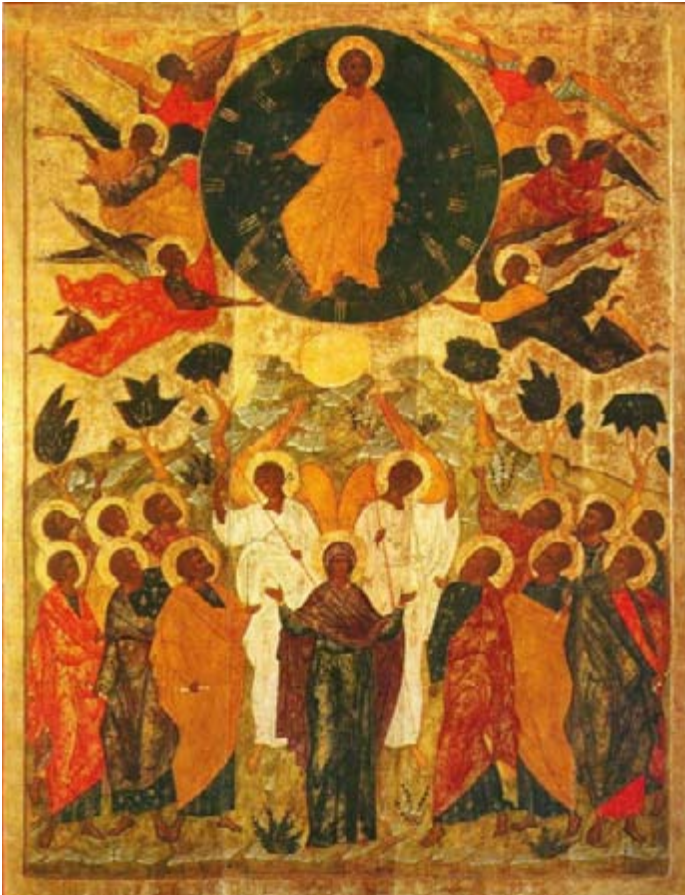
Sermon at the Feast of the Lord's Ascension.

“Id al mundo entero y proclamad el Evangelio a toda la creación”