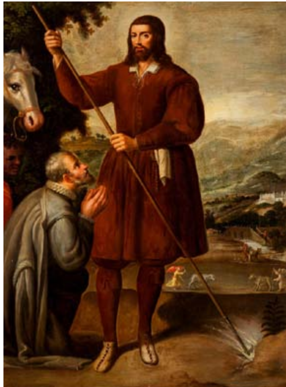
San Isidro Labrador. Jusepe Leonardo Chabacier.