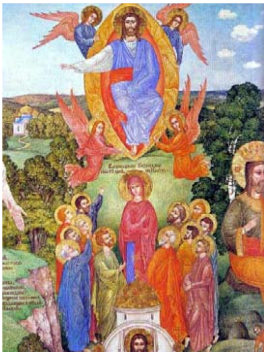
Ascensión del Señor. Antonio Bellucci.