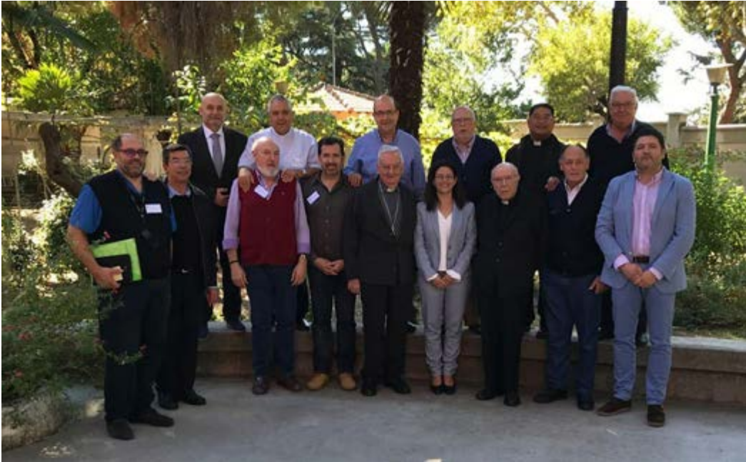
Delegados de la Pastoral de la Carretera

La Pastoral de la Carretera, aun desconocida para muchos católicos, acaba de cumplir 50 años, hecho que han podido celebrar durante las últimas Jornadas de Delegados Diocesanos de la Pastoral durante los pasados días 15 al 18 de octubre en Madrid.